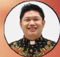
Rm. S.Tino Dwi P, Pr