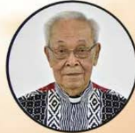
Rm. Sutopanitro, Pr