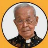
Rm. Sutopanitro, Pr